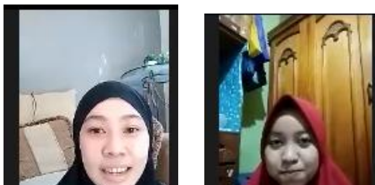
Gambar 2 Tanya Jawab tentang Public Speaking oleh Para Mahasiswa S1 Psikologi FISIP Universitas Mulawarman