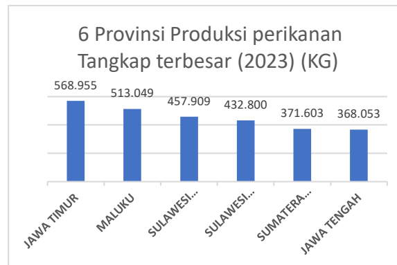
Tabel 2 Produksi Perikanan Tangkap Provinsi